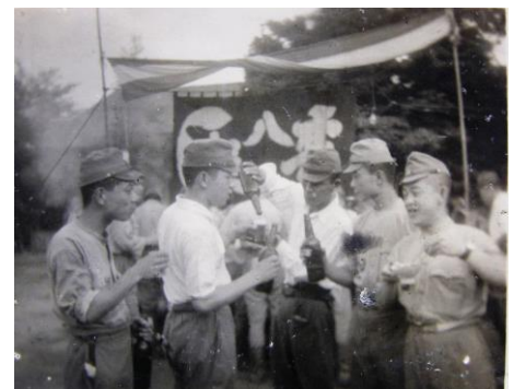
会報 18 号(H22.12)の表紙 料亭の慰問