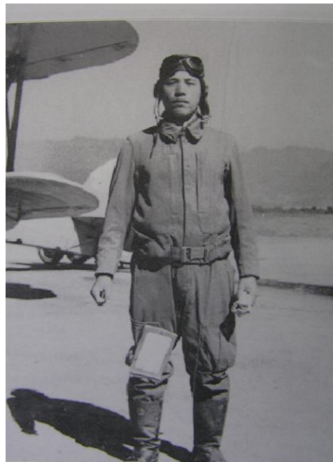
二村源八少尉（撮影地不明）

軍刀も半分に切り落とされていたのを覚えていますし、私自身、軍服を改造（今ではリフォーム）したものを普段着にしていたことがあります。